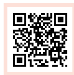
Formular auf DE