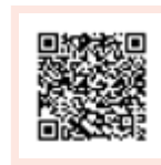
Formulaire en FR

(bei Minderjährigen muss auch ein Elternteil unterschreiben)