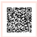
Formulaire en FR