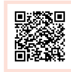
Formular auf DE