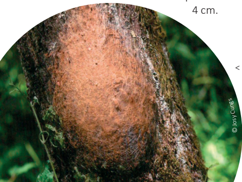
< Gespinst des Eichenprozessionsspinners

Zahl und Länge der Brennhaare nehmen mit jeder Häutung zu. Bis zum Ende des sechsten Larvenstadiums erreichen die Raupen eine Körperlänge von bis zu 4 cm.